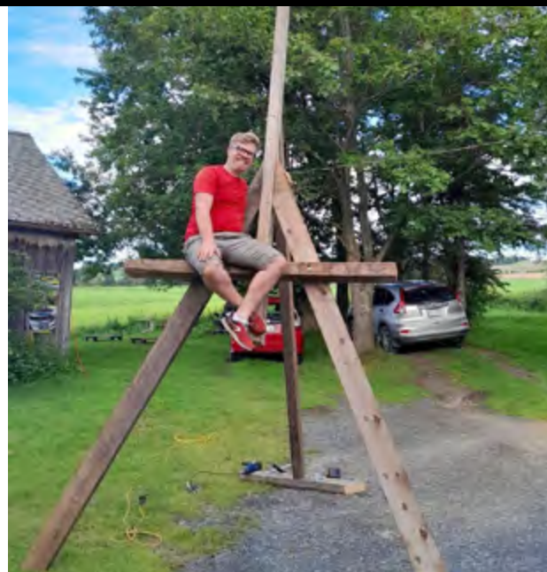
Le chantier de fabrication du chevalet avec des madriers récupérés d'une grange centenaire en Beauce.

Dans cet optique, je vous propose d'encre cet été 2024 l'installation sur la berge des baigneurs, dans la continuité des exposition en espaces publics des années précédentes : l'oeuvre de Katy Lemay en 2020 et celle de Valérie Potvin 2023.