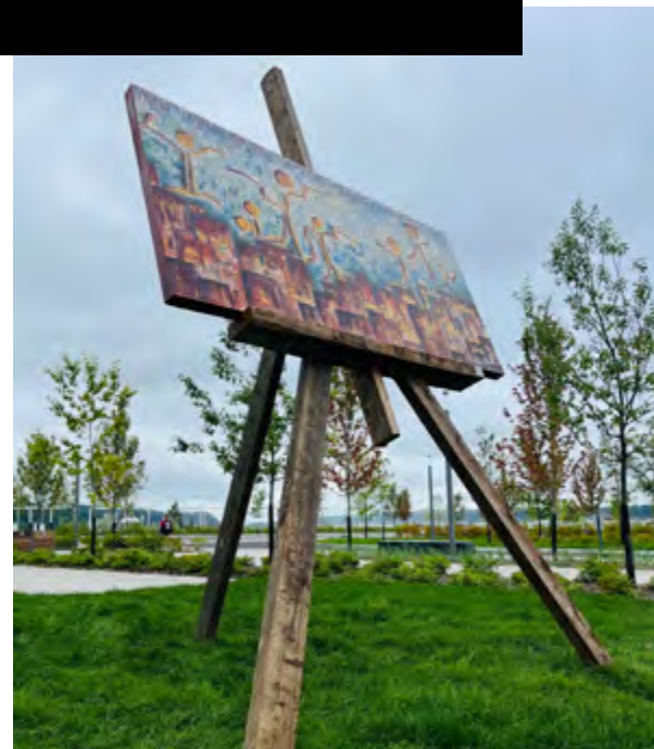
L'installation du chevalet et de la toile pendant 15 jours en août 2023 sur la berge des baigneurs de la Promenade Champlin à Québec.

Puisque la berge de Sainte Rose est aussi ma demeure. Résident une partie de l'année non loin de la berge, je la connais l'arpente en kayak.